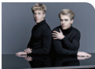
Lucas & Arthur Jussen

„Uvedomíte si, že nejde o bežnú udalosť. Nie sú to iba dvaja dobrí klaviristi, ktorí spolu hrajú. Oni cítia aj tie najmenšie individuálne interpretačné záchvevy toho druhého.“