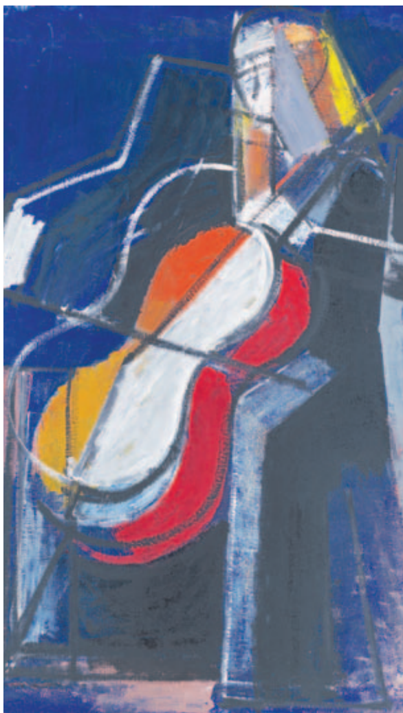
Ludovít Hološka: Violončelistka