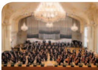
Slovenská filharmónia